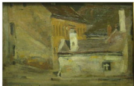
Tabán, Fehér Sas tér