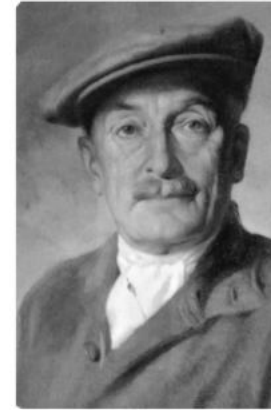
Giergl Kálmán (1863-1954)

az eklektikus és szecessziós építészet megteremtői. Legszebb munkájukkal a Zeneakadémia épületével.