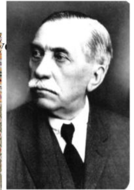
Korb Flóris (1860-1930)