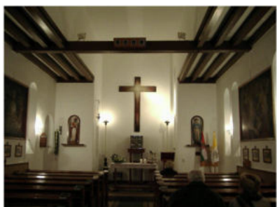
Kápolna, Hager Ritta szövött keresztjével