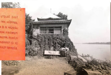
A híres kerti pagoda