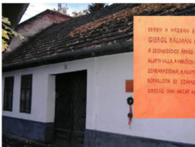
Bejárat az Árpád útról