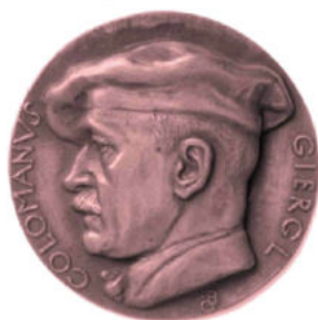
A művész bronz emlékérmé Készült 1945.