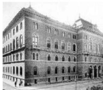
Főváros Királyi Törvényszék ( Alkotmány u. )