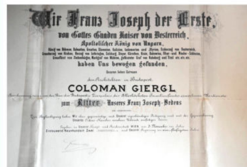
A Királyi bérház tervezéséért, a Ferenc József-rend lovagi kitüntetésé