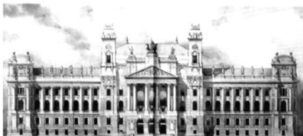
Magyar Királyi Igazságügyi Palota 1893-1896 ( ma Néprajzi Múzeum Kossuth tér 12. )

Budapesti lakása a Vörösmarthy téri Luxus Áruház épületének emeletén