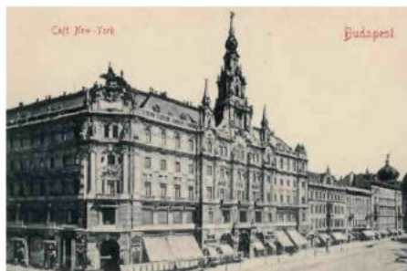
New York Palota 1891-1894 ( Erzsébet krt. 9-11 )