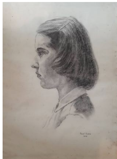
Radnai Valéria grafika