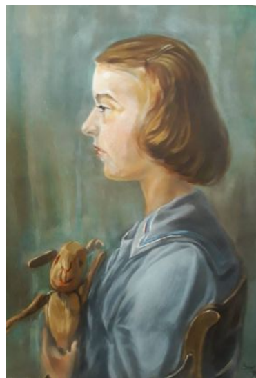
Radnai Valéria festmény