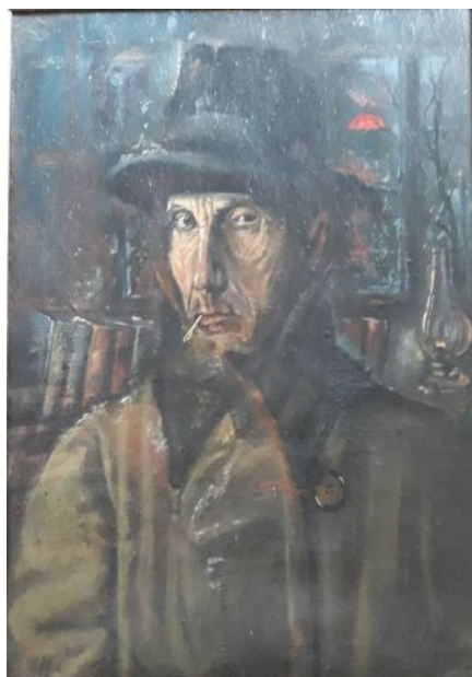
Önarckép a felszabadulásból