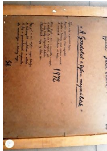
A kép hátoldala