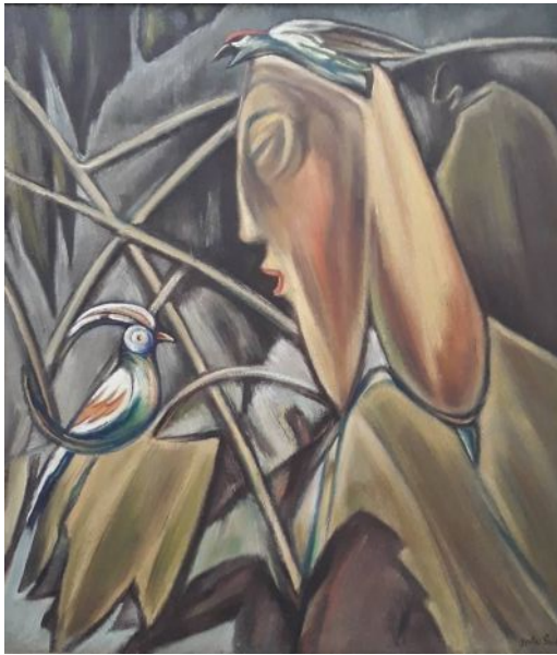
A gondolat a fejben megszületik