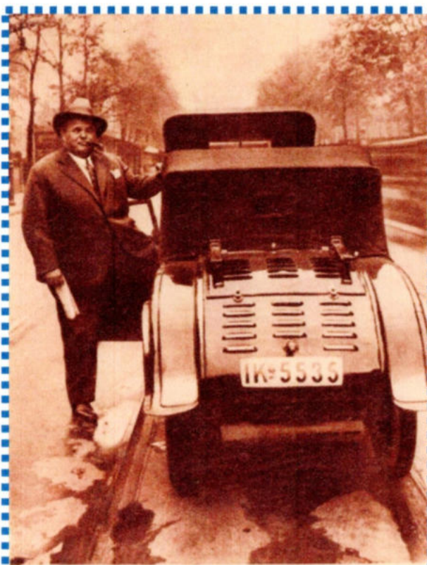
HUSZÁR PUFI Berlinben

Talán eleinte ő maga sem érte sikereinek mibenlétét ott, az államokban. A más izlésvilág? – gondolhatnánk, és bizonyosan ez is igaz. Ne feledjük, a burleszk a köznépnek szól, az a sok ezernyi mozi az államok területén, a legutolsó kis településre is elkerülő filmek révén pedig elég már néhány jól sikerült film ahhoz, hogy ismert és kedvelt lehessen valaki – nem túlzás – milliók körében. Ez egy hatalmas erő, amit csupán akkoriban kóstolhatnak mind a mozisok, mind a filmmel foglalkozók, mind pedig a színészek maguk. Az ún. sztárkultusz első lépései ezek, amelyek hatásmechanizmusát ma már értjük valamelyest, akkoriban csupán ízelgetik világszerte. Charles H. Puffy beérkezéséhez azonban egy érdekes előzmény is hozzátartozik, mégpedig kezdetben Duci bácsi, majd később Mr. Fatty ragyogása és nevezetes bukása.