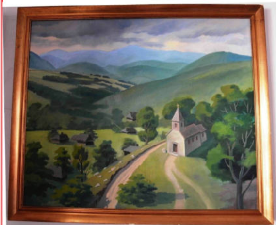
Olajfestmény a templomról

Ezen a helyen egy Árpád-kori templom állt, melyet 1930 – 32 - ben tártak fel.