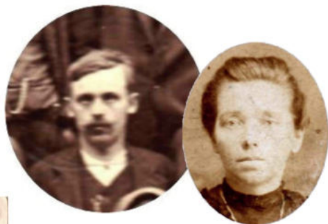
Édesapja és édesanyja