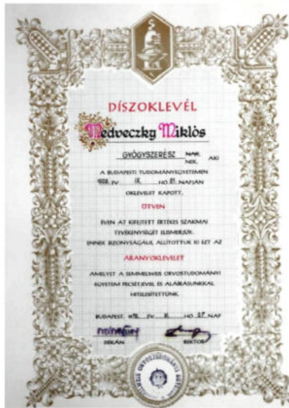
50 éve gyógyszerész - arany oklevele -