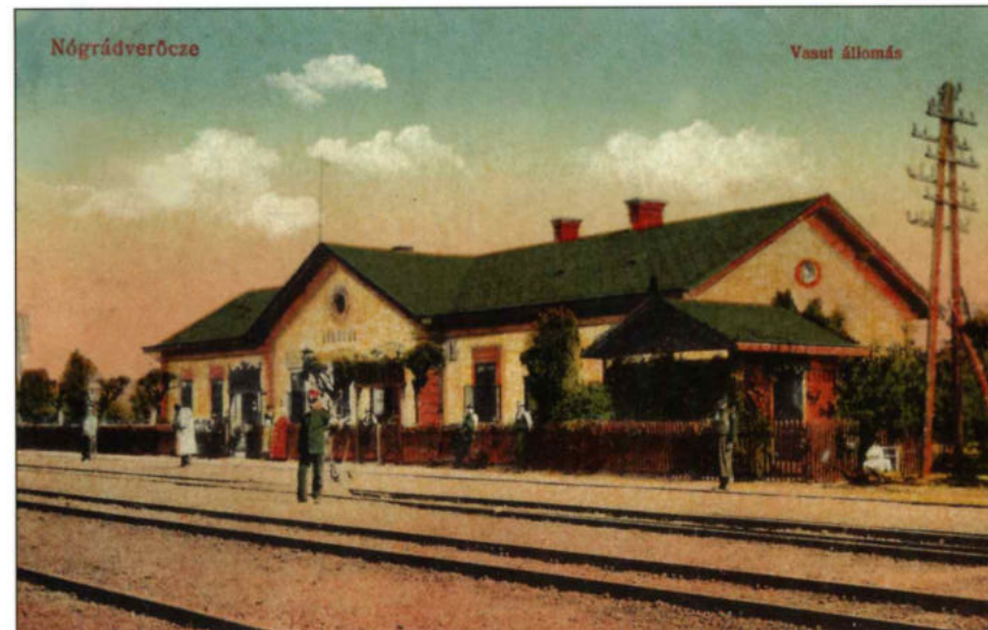
A vasútállomás – két nézőpontból

A Katalinpuszta felé vezető Lósi-völgy feletti dombon álló kenyérforma épület alapkövét 2009-ben rakták le.