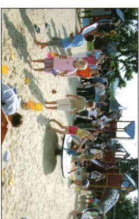
A Duna-parti új játszótér