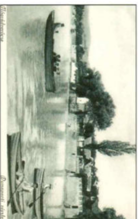
A csónakázás is kedvenc szórakozás volt