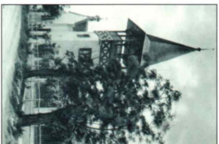
A közismert tűztorony