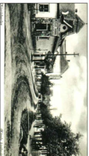
A Károly király tér