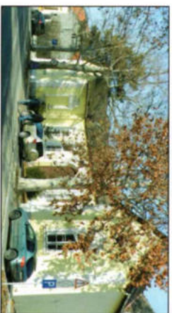
Könyvtár, múzeumok A támfal napjainkban