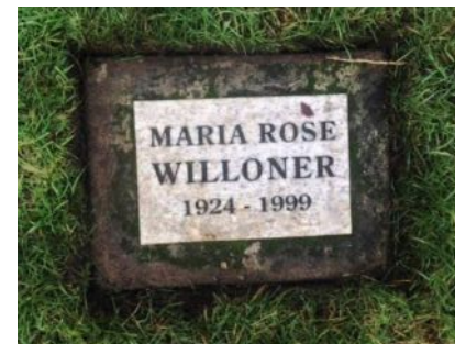
Willoner Róza síremléke Canada Surrey város temetőben (SL-CEDAR 011B-10)