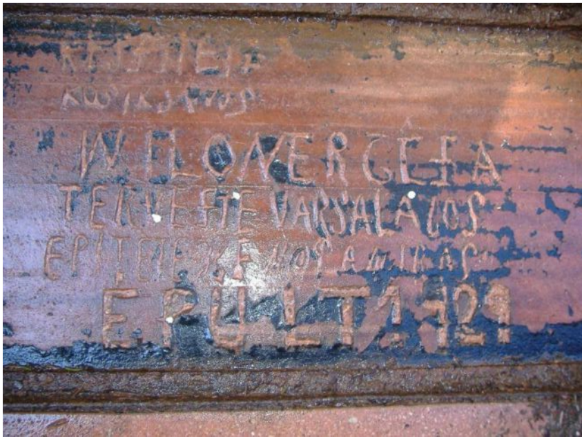
A penzió bejáratánál a lábrács alatti jelzések

Az építkezés 1929. október 10-én fejeződött be.