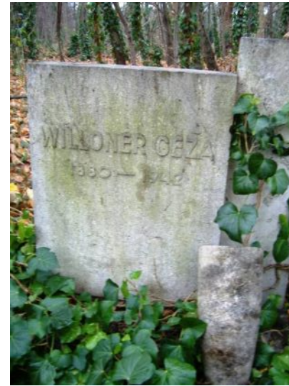
Willoner Géza sírja a Fiumei úti temetőben (Sírkert 50-050.1)