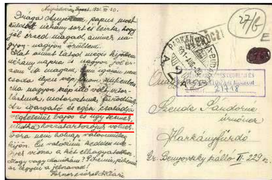
Képeslap küldése a penzióban történt tartózkodásról, 1931