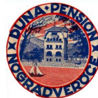
Ragasztható matrica 1929.